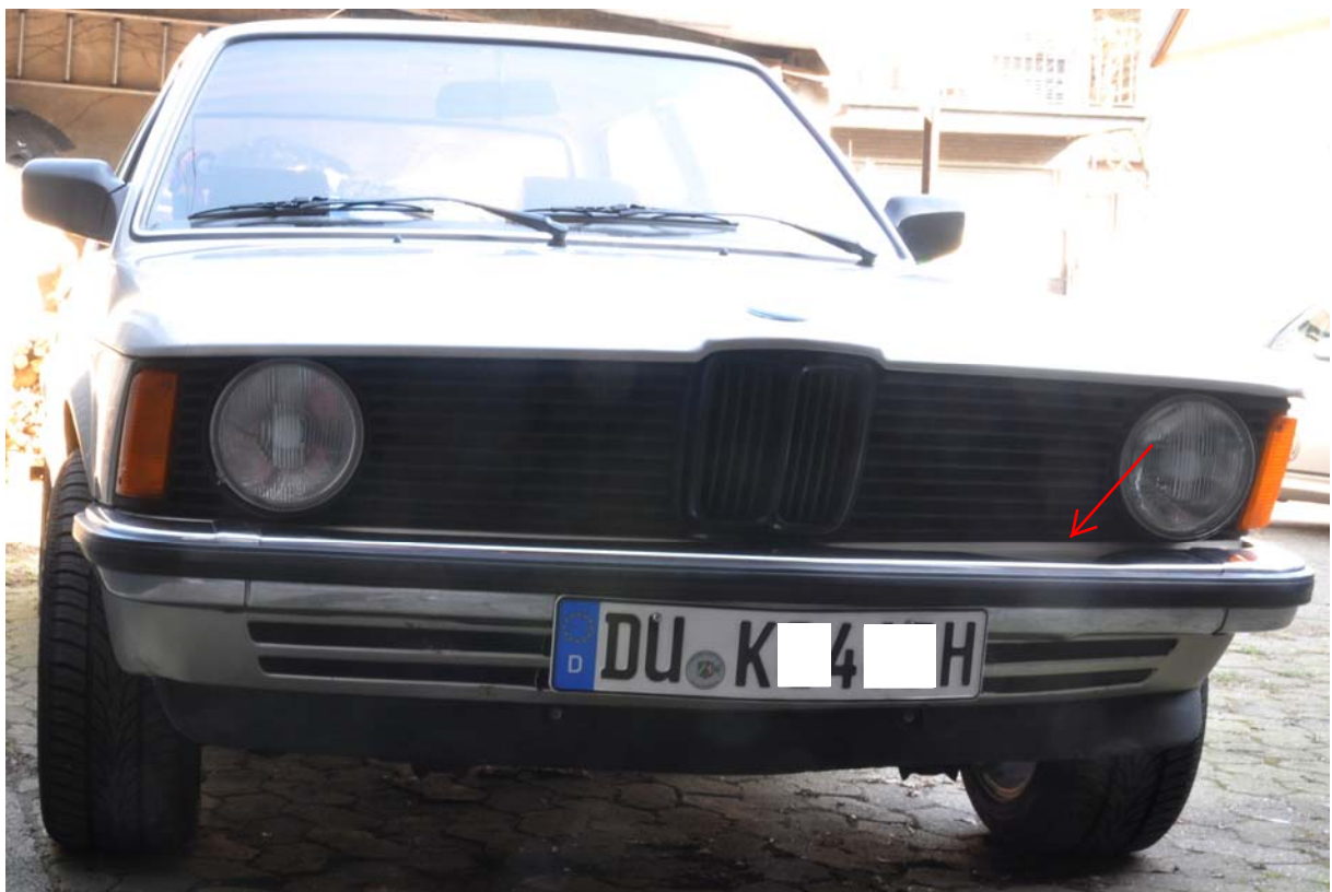
Mittelteil der Stossstange oben links verzogen