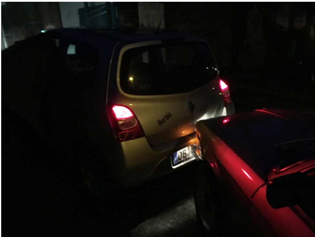
stehendes Fahrzeug lt. Auftraggeber