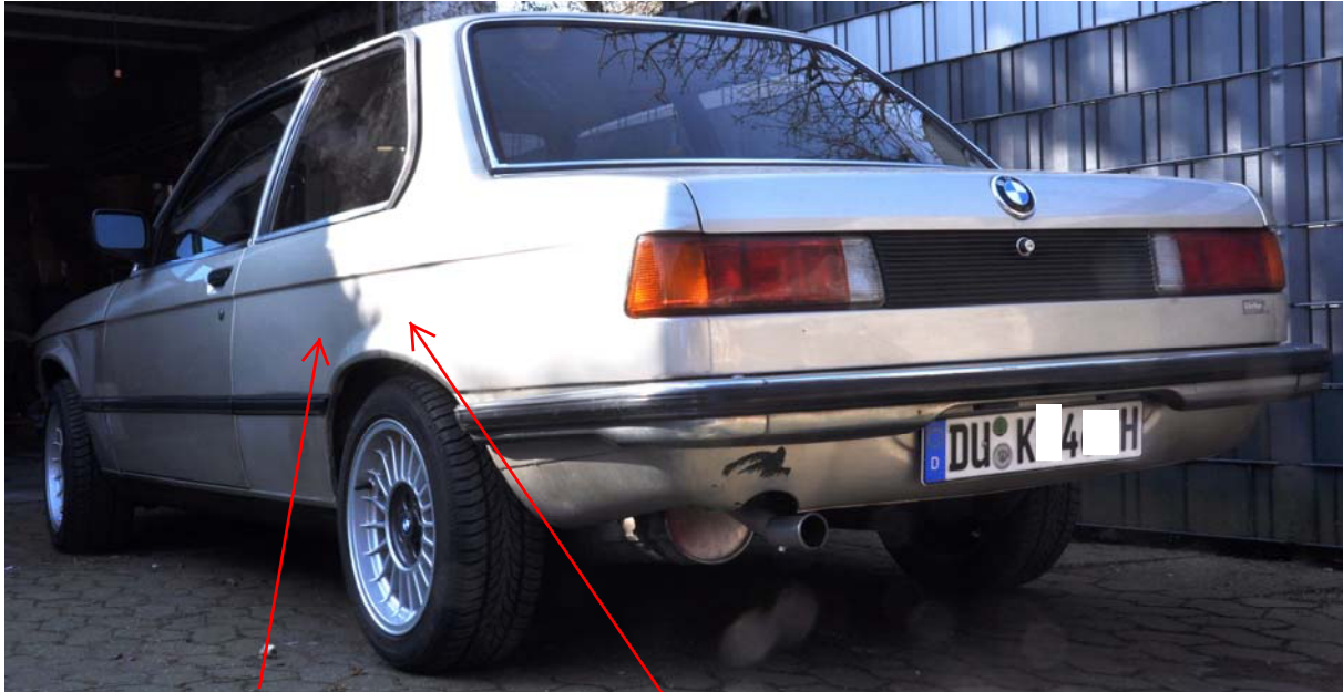
Fahrzeug weist kleinere Dellen und Spachtelstellen auf